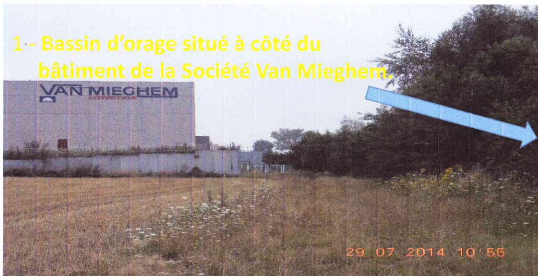
1 - Bassin d'orage situé à côté du bâtiment de la Société Van Mieghem.