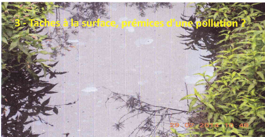
3 - Taches à la surface, prémices d'une pollution ?