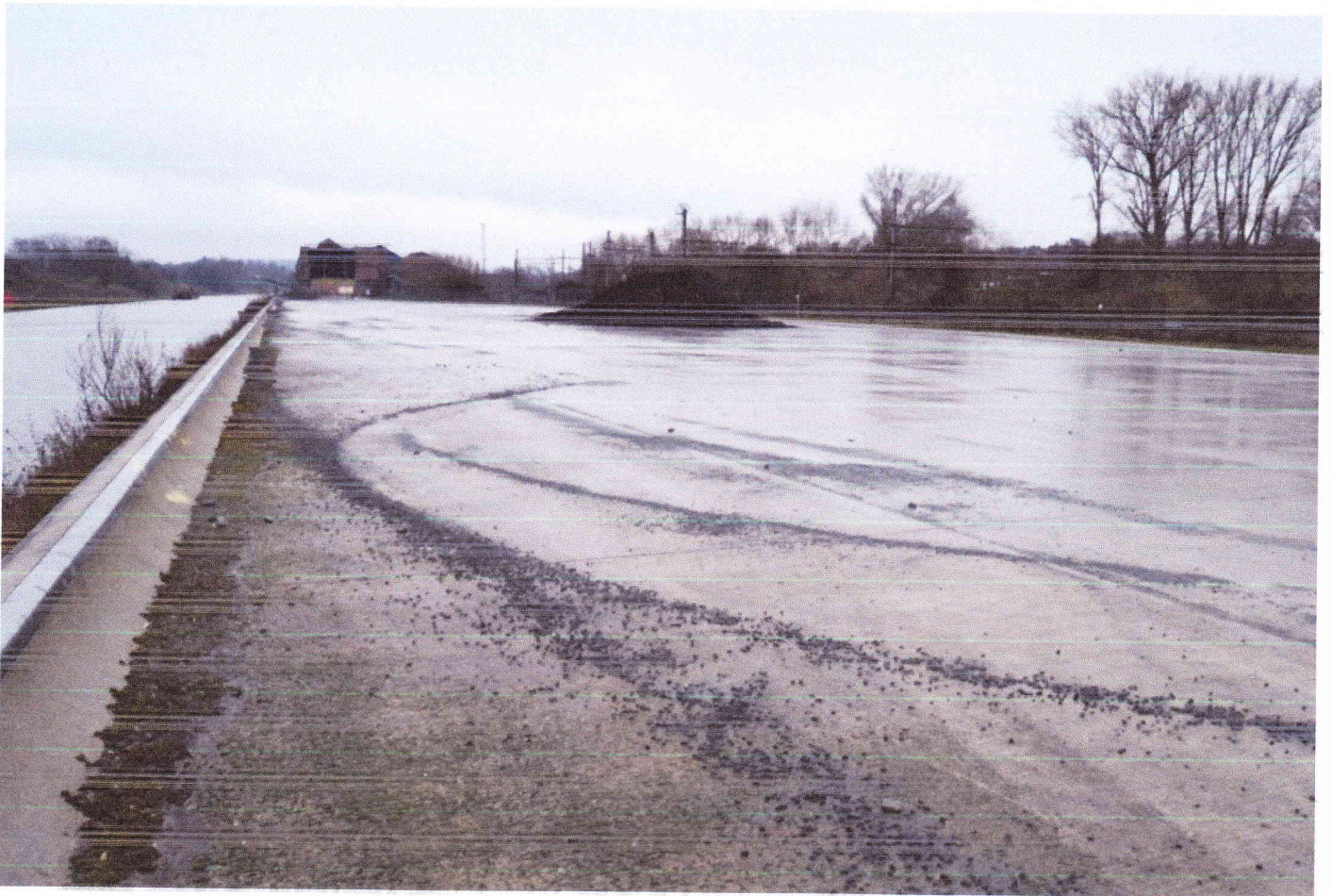
Port de Clabecq totalement sous- exploité