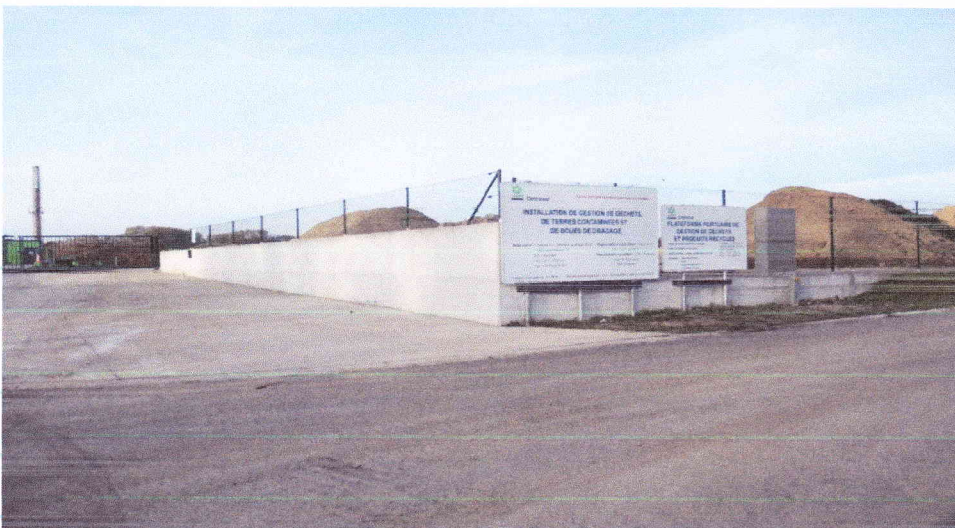
Terres polluées à proximité des habitations

Etant donnée l'étendue du site et la diversité des activités, nous pensons particulièrement à la plateforme portuaire CETRAVAL dont une des activités principales est la gestion des terres polluées, nous craignons fort que lors de pluies, ces terres polluées ne ruissèlent et contaminent les eaux du canal, de la Sennette et de la Senne situés directement à proximité de cette dalle CETRAVAL. (Dans ce cadre avez-vous demandé l'avis de la DGO2 et DGO3 ?) De plus et lors de périodes de sécheresse nous craignons que des vents n'entraînent les poussières polluées se trouvant sur la dalle CETRAVAL en direction de la rue des Déportés, de l'école Wautrequin, de la rue des Forges et le centre de Tubize situé à proximité.