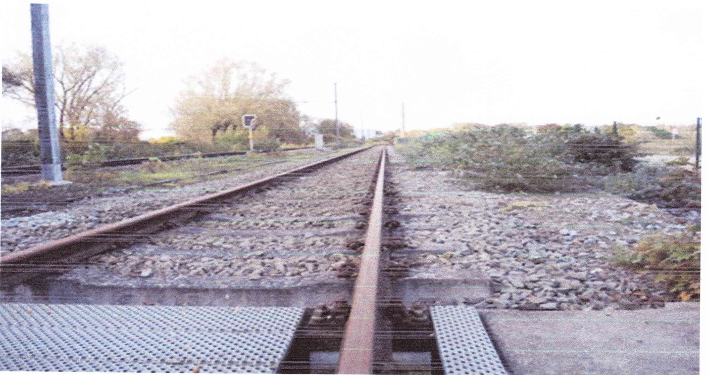
Rails qui rouillent !!!!!!!