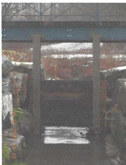
Dispositif de retenue statique et non réglable du « PARADIS »

Le dispositif actuel ne permet pas ce blocage.