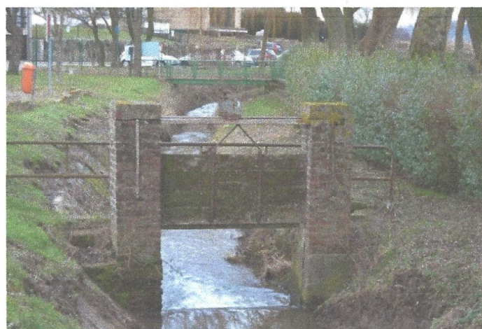
Très ancien ouvrage de retenue réglable situé sur le le Coeurcq. Un ouvrage peu coûteux de ce type, permettrait de bloquer et de dévier totalement l'eau du Hain dans la ZIT du «PARADIS»