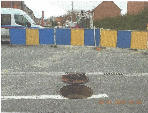
Rue du Stierbecq, taque sous laquelle coule l'Achonfosse. (En face du n°45)