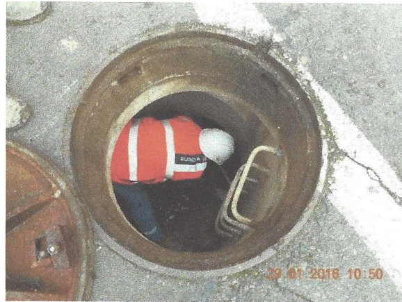
Le diamètre du tuyau de fuite de l'Achonfosse sous cette taque est de + ou - 75 cm.