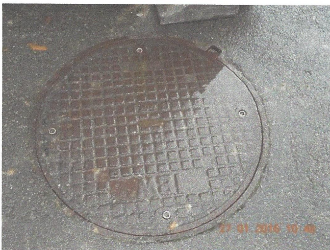
Vu la violence des débits de l'Achonfosse, les services techniques ont été contraints de boulonner cette taque. Bonne preuve qu'il y a d'énormes problèmes de pression.