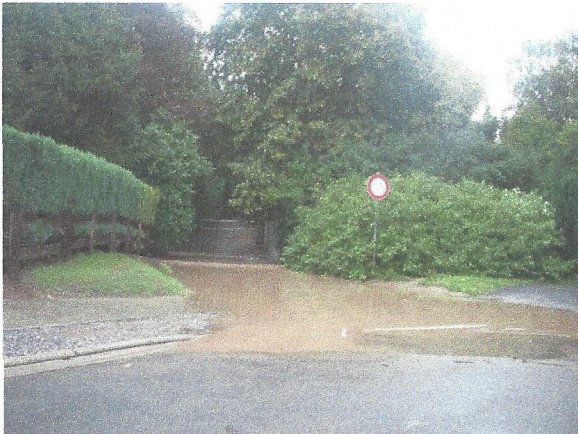
Débordement dans le cul sac de la rue du Midi. (au niveau du chemin montant vers la Chée. d' Hondzocht). (23/08/2011)