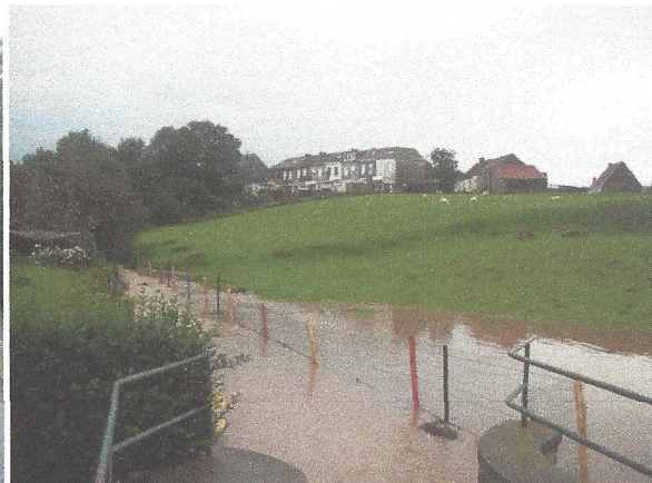
Situation de l'Achonfosse à l'arrière des maisons de la rue du Midi et de la rue de la Briqueterie.