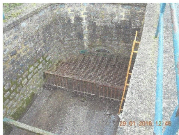
Le diamètre du tuyau de fuite de cet ouvrage est 70 cm.