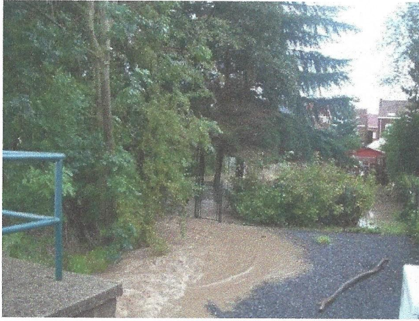
L'Achonfosse juste après l'ouvrage, débordant dans les jardins vers la rue du Stierbecq. (23/08/2011)