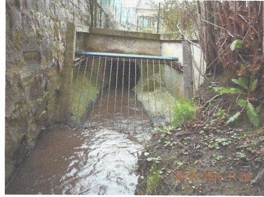
Pertuis de l'Achonfosse sous un jardin à l'arrière d'une maison de la rue du Stierbecq. Le diamètre de ce pertuis fait 75 cm.